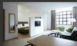
The More Hotel